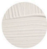
Wevet No.273, Farrow & Ball