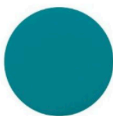
Gontran, collection La Premium, Mercadier