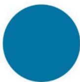
Mykonos OROC36, Ressource