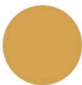
Curcuma, collection Colorissim, V33