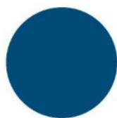
Classic Blue, collection Pantone, Tollens

Des couleurs marquées et profondes avec, dans le premier rôle, l'incontournable bleu à associer à des tons plus discrets, pour calmer le jeu en beauté.