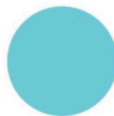
Ciel, ID Paris