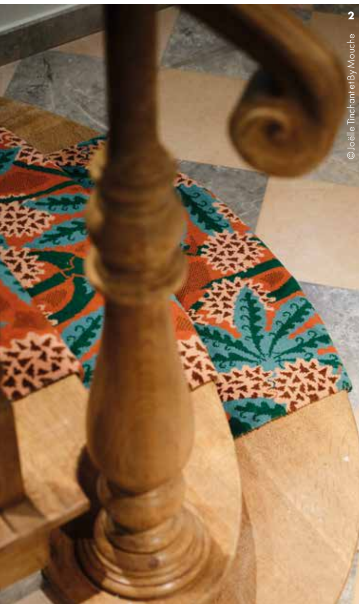
2 © Joëlle Tinchant et By Mouche