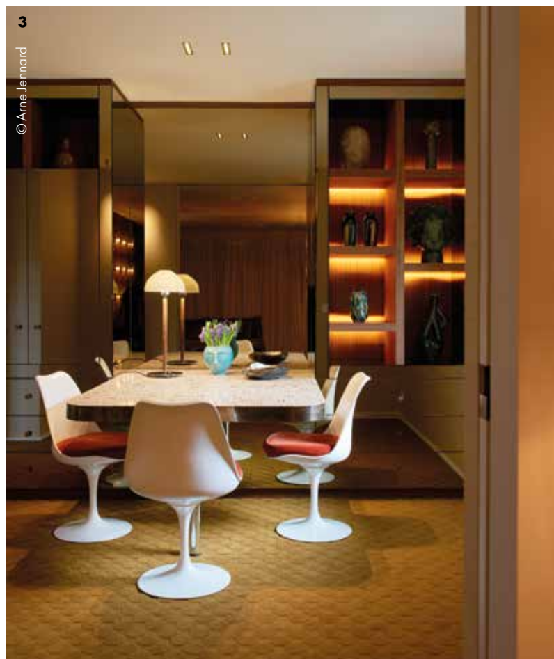
3 © Arne Jernard