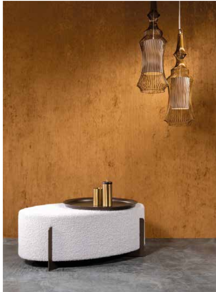
ARTE, Corduroy non-woven wallpaper, Lush collection - arte-international.com