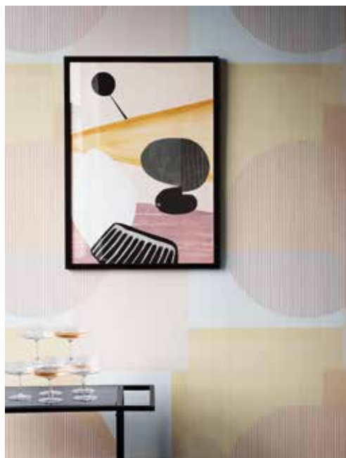
AU FIL DES COULEURS, non-woven wallpaper Memphis - aufildescouleurs.com

Following in the tradition of the Bauhaus, the Memphis design movement worked with colour to break away from the standardisation of production. The designers who are heirs to this Italian collective continue to create furniture with simple volumes, crafted like modern sculptures, coloured like toys. They design graphic compositions and colour planes in a range of inventive colour combinations. >