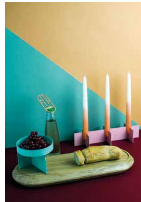
DAY STUDIO, Avlu table accessories, Crafted Minimalism collection - day-studio.com

Dans la salle de bains, la couleur se travaille en rangements, robinetterie voire équipements sanitaires. C'est un moyen de rendre la pièce plus accueillante, de la relier au reste de l'espace, d'attirer l'attention sur une fonction. Un papier peint panoramique ou avec des motifs XXL agrandit, sublime une petite surface et repousse les murs. Et si la couleur changeait tout ?