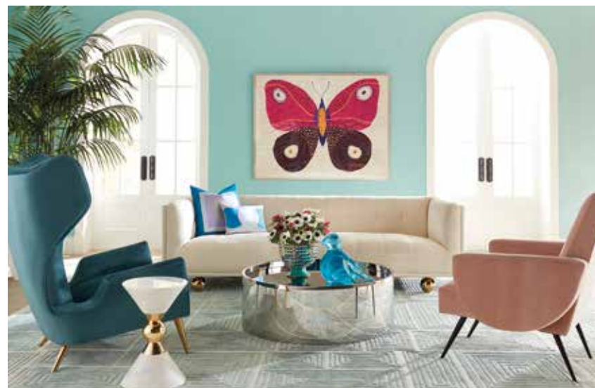
JONATHAN ADLER, Philippe and Milano armchairs, Claridge sofa and Alphaville coffee table - jonathanadler.com

Interior designers and architects use colour to organise a space and give it rhythm, to define functions: coloured armchairs that highlight the design of a table top, chromatic reminders creating correspondences between objects, different shades to make each of the seats unique, harmony around a key colour, such as blue, that serves as a signature. ▷