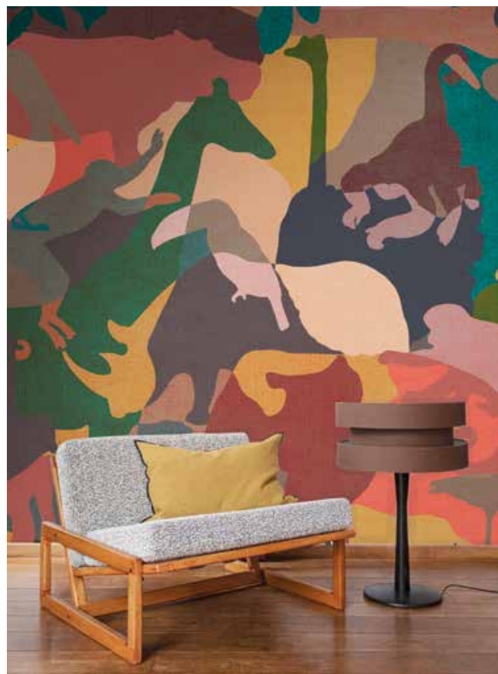
PASCALE RISBOURG, non-woven wallpaper from the Zanimos collection pascale-risbourg.com