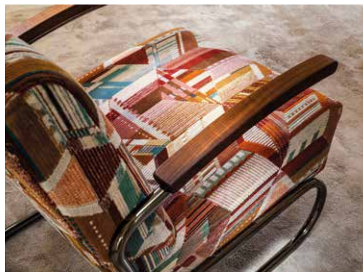
MISIA, Rêverie Persane fabric, French Riviera collection - misia-paris.com

T issus, papiers peints, tapis... les murs et sols se nappent de motifs affirmés. La géométrie s'exprime aussi à travers l'influence des styles ethniques recolorés dans une palette très contemporaine de demi-teintes. Animaux, peaux de bêtes, éléments naturels et symboliques sont travaillés dans des proportions différentes pour gagner en élégance.