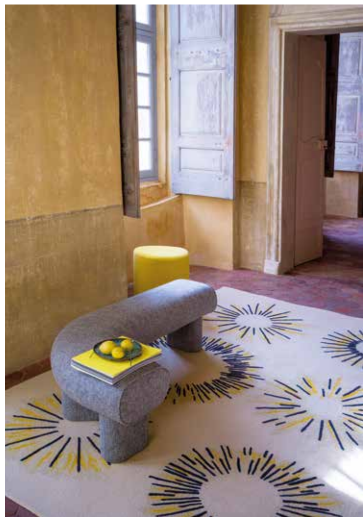
PIERRE FREY, bench by Guillaume Delvigne, Sao Paulo footstool covered with Hyères fabric, Sunny mat - pierrefrey.com