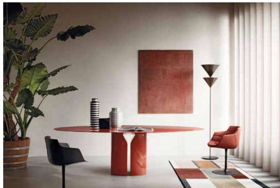
MDF Italia, NVL table in lacquered MDF by Jean Nouvel - mditalia.com

An invitation to experiment with a place, colour can be used to create contrasts or subtle colour gradations, to highlight a work of art, a piece of furniture or lighting. It makes an object unique, brings out the lines of an armchair, the volume of a cupboard. A modern colour remodels a classic and iconic piece of design. A painting comes into its own when its colours match its surroundings. On the other hand, if it stands out from a harmonious background, its presence will have even more of an impact.