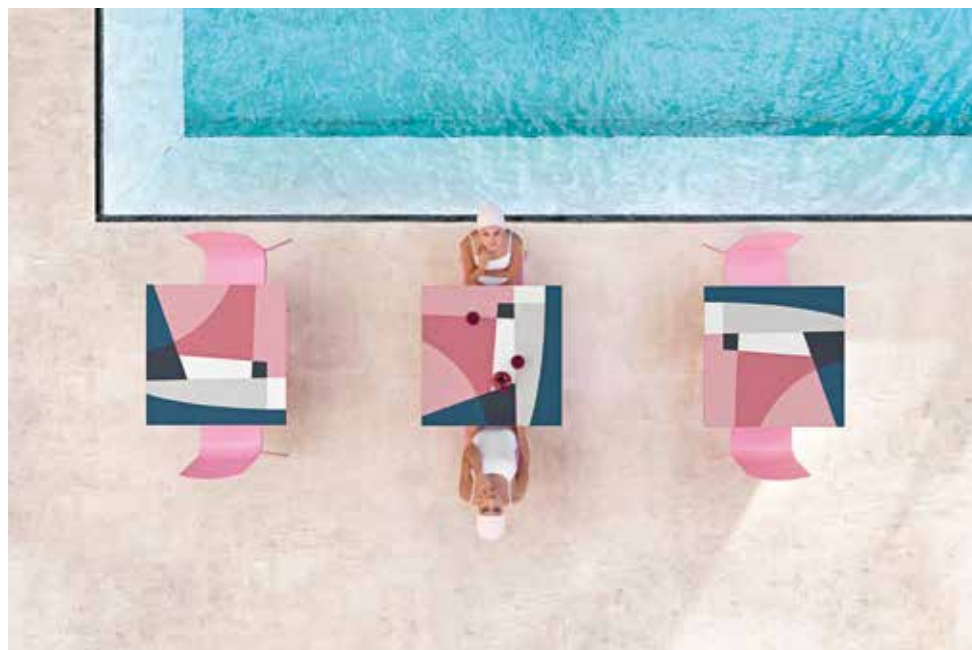
DIABLA, Abstrakt Mona tables in phenolic resin by Jonathan Lawes - diablaoutdoor.com