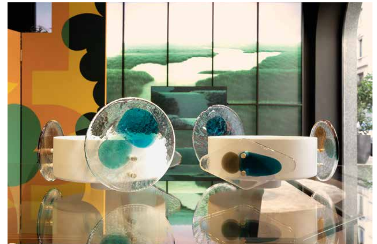
CASSINA and VENINI, Colourdisc cups in Murano glass by Bethan Laura Wood - cassina.com