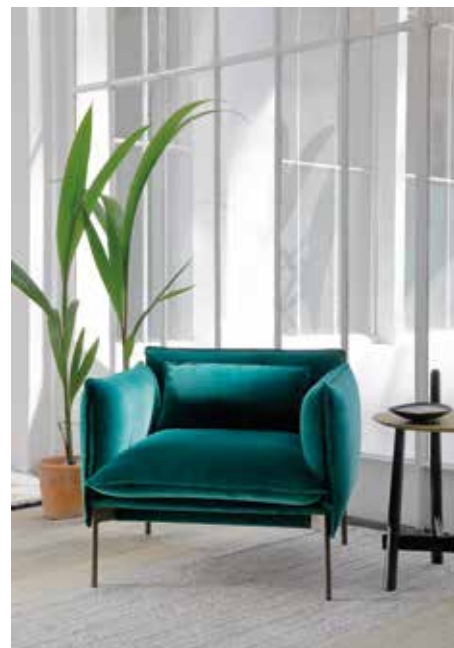
COEDITION, Palm Springs armchair from Anderssen & Voll - coedition.fr - Photo: © Nicolas Millet

Invitation à expérimenter un lieu, la couleur se travaille en contraste ou en faux camaïeux, pour mettre en valeur une œuvre d'art, un meuble... un éclairage. Elle rend un objet unique, souligne les lignes d'un siège, le volume d'un rangement. Une teinte actuelle redessine une pièce de design classique et iconique. Un tableau s'intègre mieux dans une pièce lorsque ses couleurs répondent à l'espace. Par contre, s'il se détache de l'harmonie choisie en toile de fond, sa présence sera plus forte.