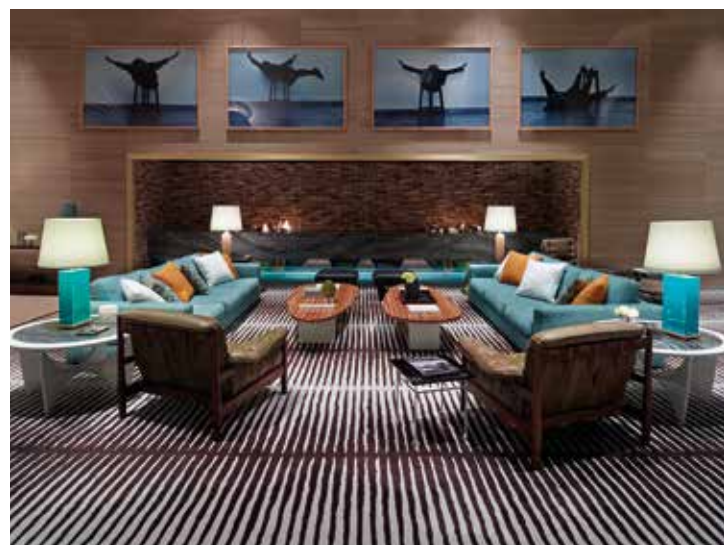
CODIMAT, Zebstripe rug in hand-tufted wool - codimatcollection.com

Whether fabrics, wallpapers or carpets, our walls and floors no longer shy away from assertive patterns. The influence of ethnic styles is seen in geometric shapes that adopt new colours in a very contemporary palette of half tones. Animals, animal skins, natural and symbolic elements are reworked in different proportions for a more elegant style. ▶