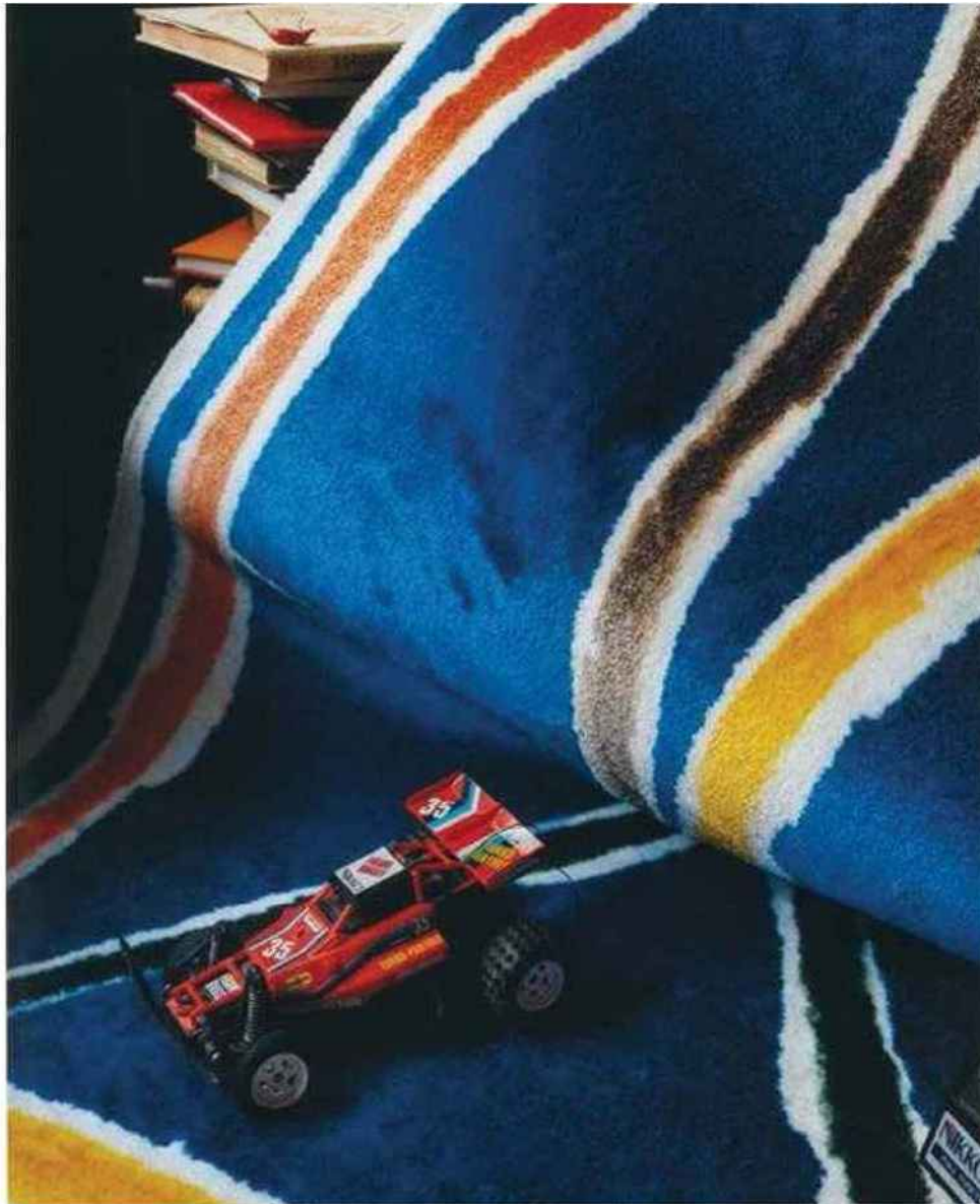
Tapis Parcelles d'Alexandre- Benjamin Navet, Codimat, 1 500 € en imprimé, 2 500 € en tufté. codimat- collection.com

Sylvain, Pierre-Philippe, Schering-Plough, Juliette de Cadeval