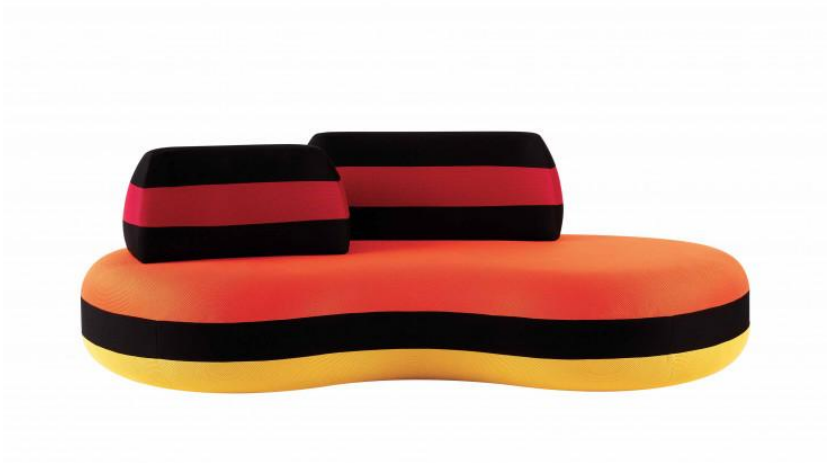
Canapé Bombom de Joanna Vasconcelos ( Roche Bobois).

3/ Toutes les nouveautés des grands éditeurs