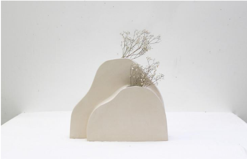
Vase Colline d'Elisa Uberti (Folks).

3/ Toutes les nouveautés des grands éditeurs