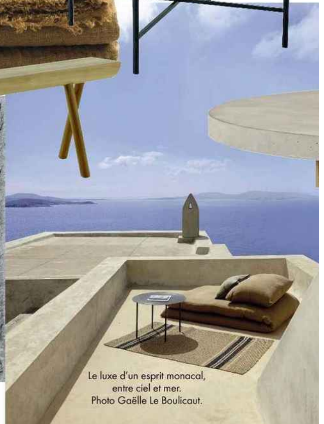
Le luxe d'un esprit monacal, entre ciel et mer.