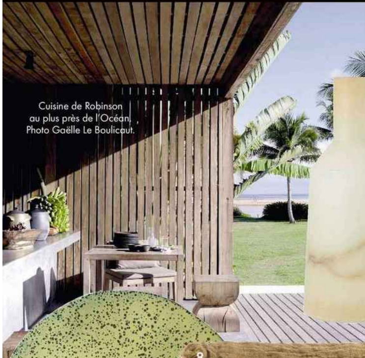
Cuisine de Robinson au plus près de l'Océan.