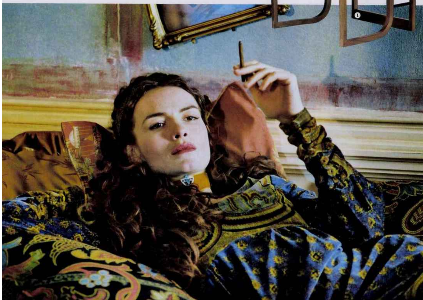
Saffron Burrows dans Klimt de Raoul Ruiz (2006). Saffron Burrows in Klimt by Raoul Ruiz (2006).

Maximalist geometrical motifs emanate a modernist atmosphere infused with Sturm und Drang .