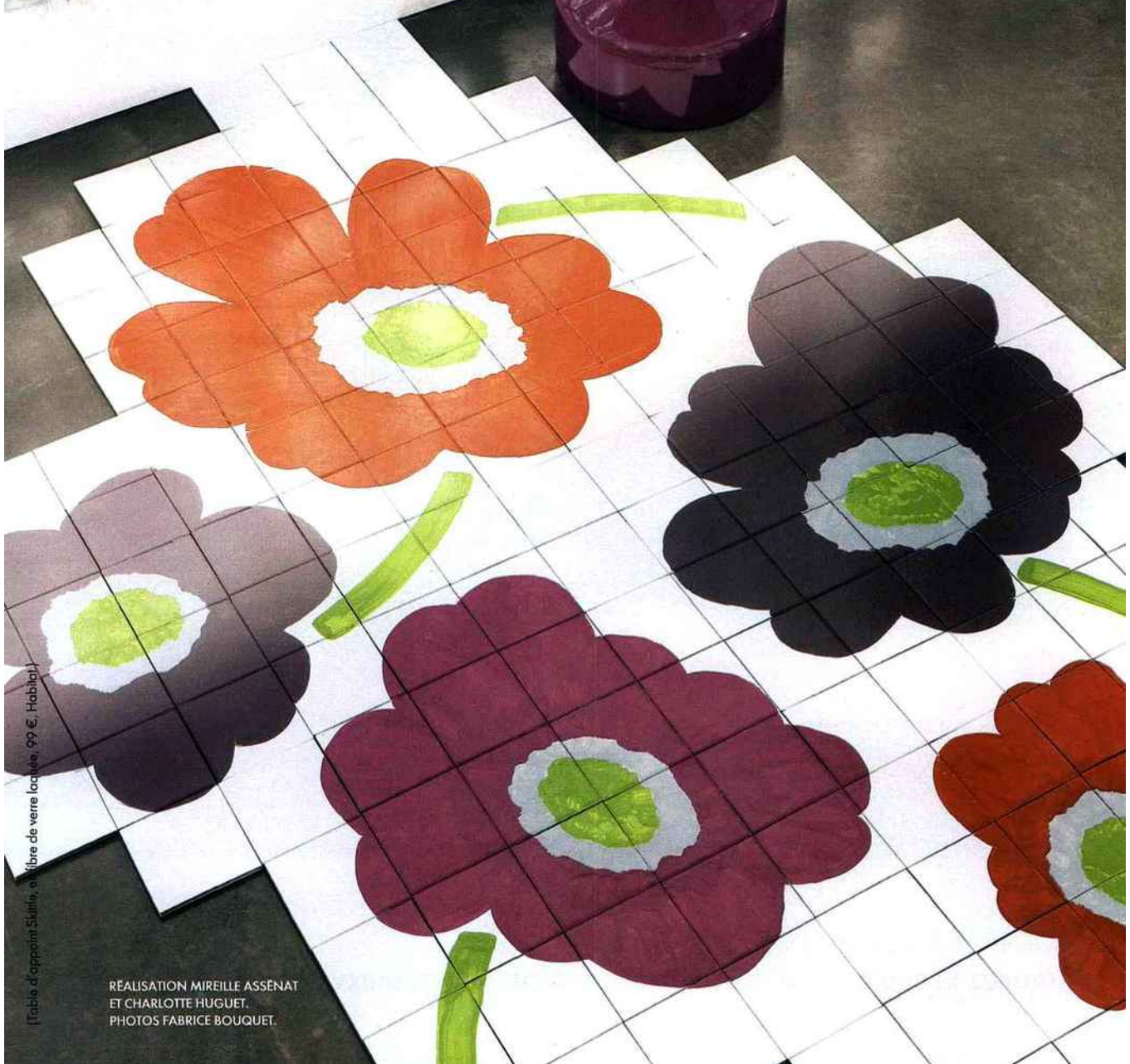
Table d'appoint Skutis, en fibre de verre laquée, 99 €, Habitat.

RÉALISATION MIREILLE ASSÉNAT ET CHARLOTTE HUGUET.