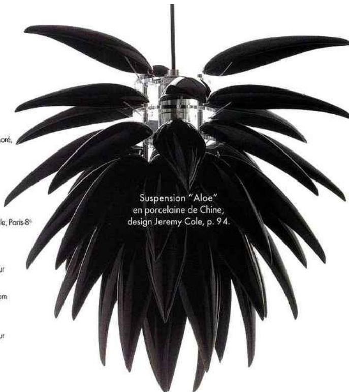
Suspension "Aloe" en porcelaine de Chine, design Jeremy Cole, p. 94.

BOUSSAC , 27, rue du Mail, Paris-2 e (01 42 21 83 58); www.pierrefrey.com/boussac BRUNSCHWIG ET FILS , rens. sur www.brunschwig.com CASAMANCE , rens. au 03 20 61 72 22 et sur www.casamance.com CRÉATIONS MÉTAPHORES , rens. au 01 46 33 03 20 et sur www.creations-metaphores.com , DEDAR , rens. sur www.dedar.com DESIGNERS GUILD , rens. sur www.designersguild.com HOLLAND & SHERRY , rens. sur www.hollandandsherry.com HOULES , rens. sur www.houles.com MANUEL CANOVAS , rens. sur www.manuelcanovas.fr NOBILIS , 29, rue Bonaparte, Paris-6 e (01 43 29 21 50); www.nobilis.fr OSBORNE AND LITTLE , rens. au 01 55 69 81 06 et sur www.osborneandlittle.com PIERRE FREY , rens. au 01 44 77 36 00 et sur www.osborneandlittle.com RUBELLI , rens. au 01 56 81 20 20 et sur www.rubelli.com