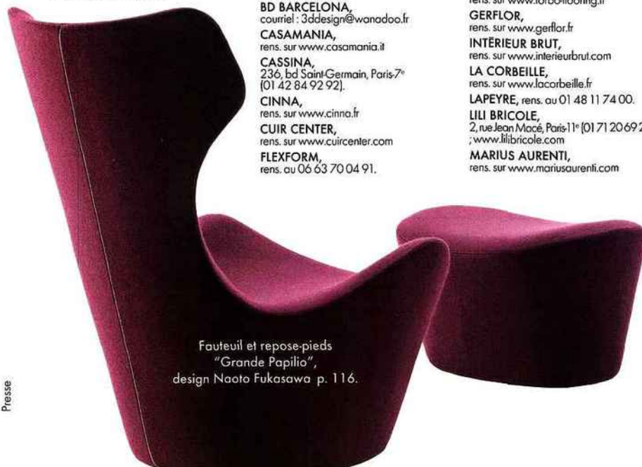
Fauteuil et repose-pieds "Grande Papilio", design Naoto Fukasawa p. 116.

FLEUX , 39, rue Sainte-Croix-de-la-Bretonnerie, Paris-4 e [01 42 78 27 20] ; www.fleux.com